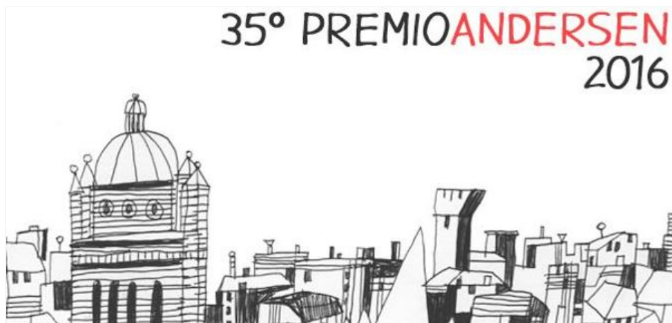
Il logo dell'edizione 2016 della rassegna (disegno di Gek Tessaro)